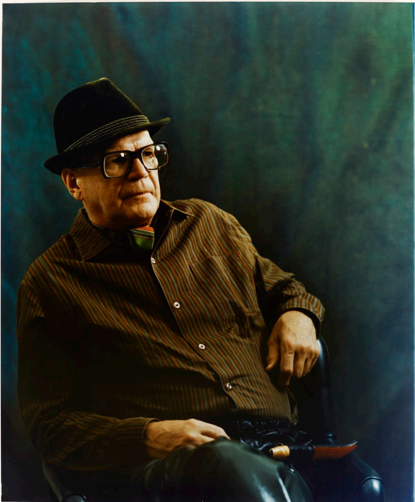
Presidentti Kekkonen, 1975