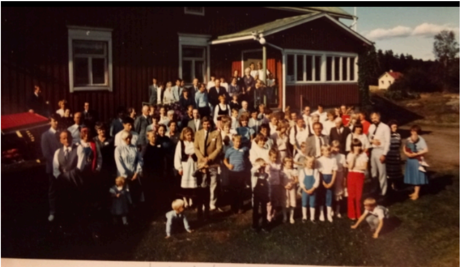
Sukukokous Pokkolan Pakulassa, Liedossa, 1983.