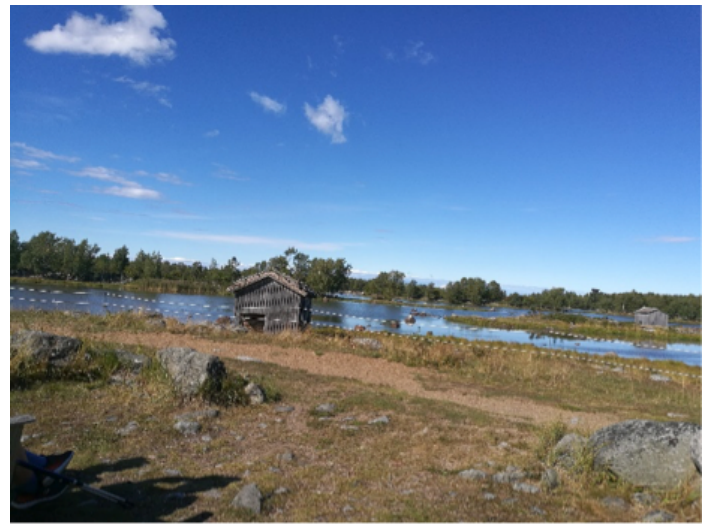
Välillä on hyvä jättää kotitoimiston ahertaminen ja näkymistä iltakävelyllä.