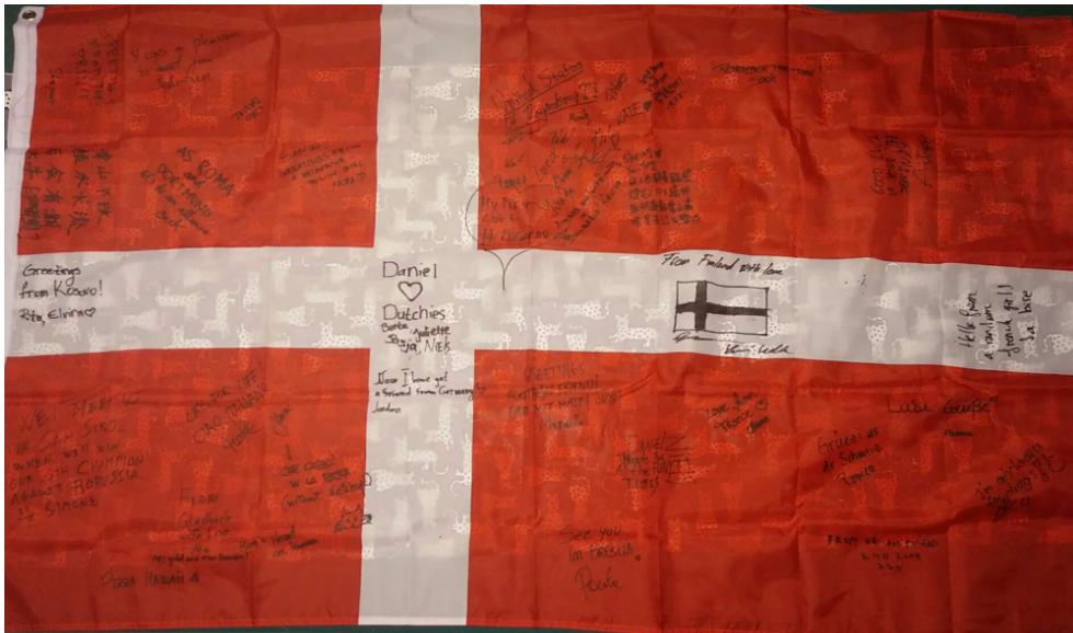
Tanskan lippu, johon on kirjoitettu vaihto-opiskelijoiden nimikirjoitukset ja terveiset.