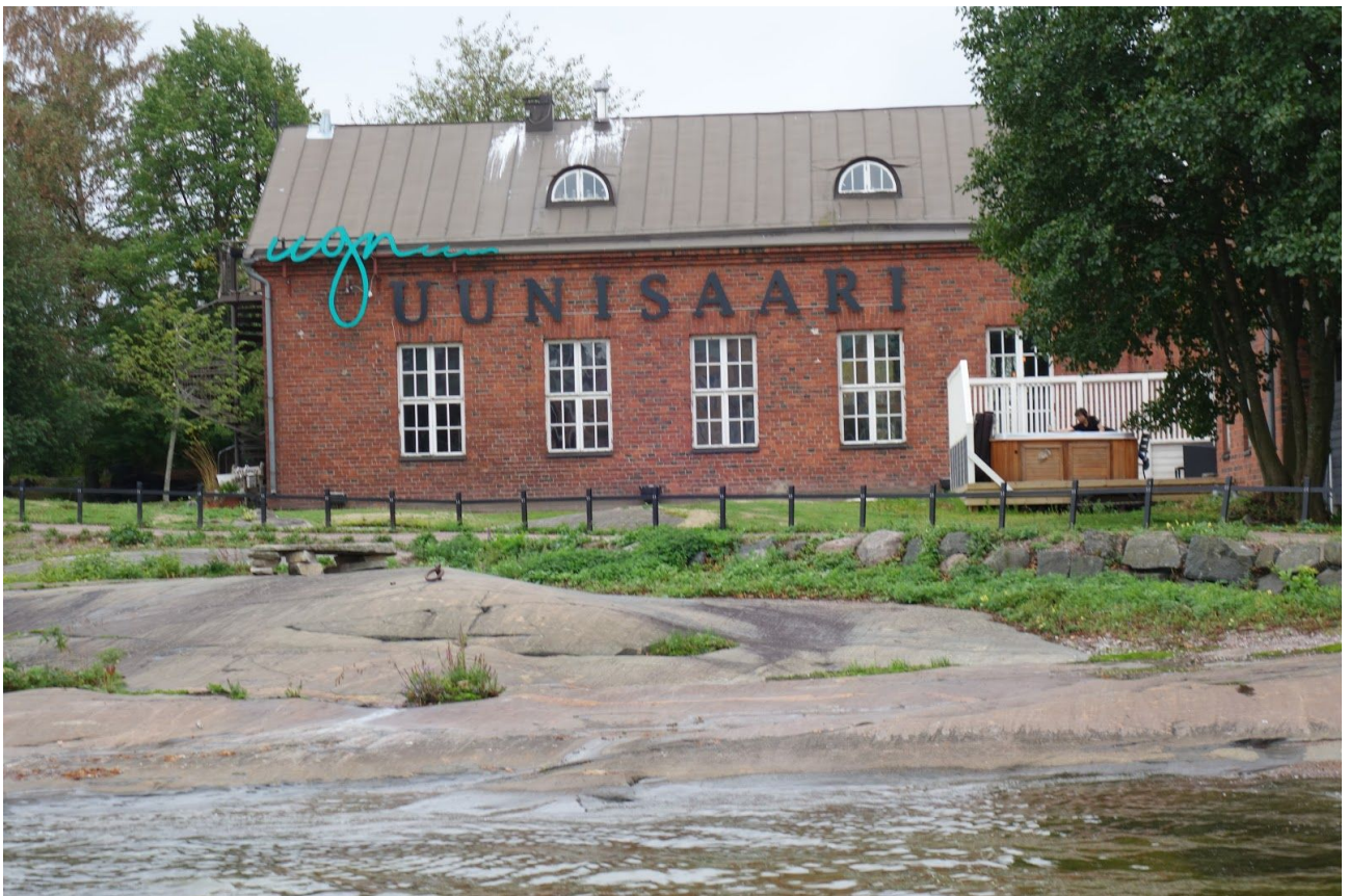
Uunisaaren edustalla.