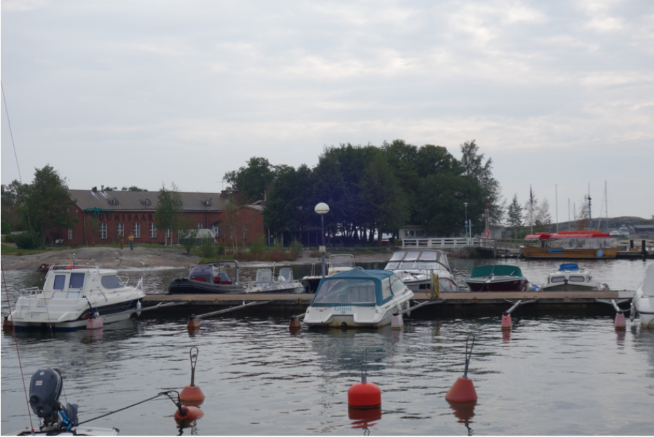
Ravintola Uunisaaren edustaa.