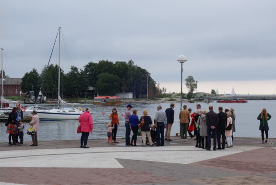
Yhteysalusta odottamassa Merisatamarannassa.