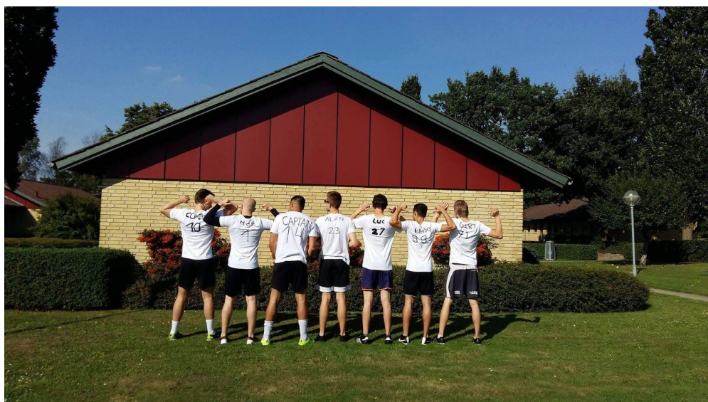
Allekirjoittaneen kampuksen jalkapallojoukkue

Koulumme sijaitsi Odensen juna-aseman vieressä, lähellä keskustaa. Koulu oli juuri valmistunut ja tarjosi upeat puitteet opiskeluun. Itse opiskelu oli hyvin samankaltaista kuin Suomessa, kurssit muodostuivat luennoista ja projektitöistä. Koulutuksen suunnittelussa oli otettu hyvin huomioon vaihto-opiskelijat. Opettajat puhuivat hyvää englantia ja esimerkkeinä käytettiin kansainvälisiä yrityksistä ja tapahtumista, jotta muutkin kuin tanskalaiset opiskelijat ymmärsivät.