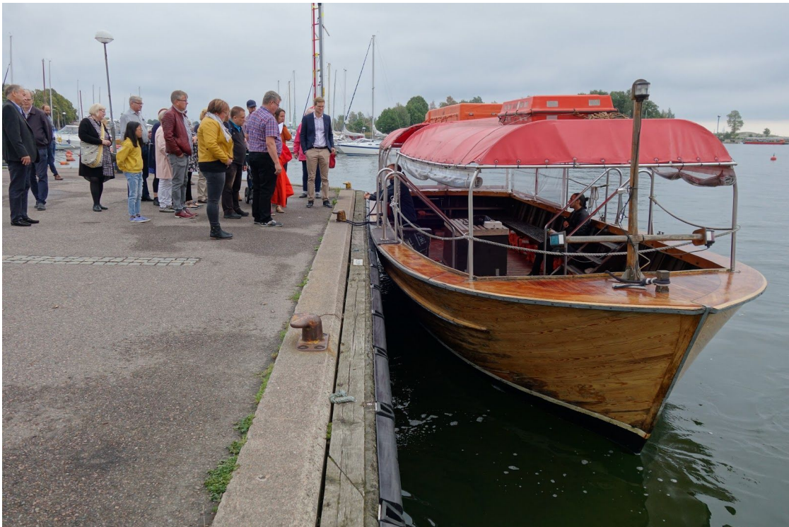
Väki odottaa yhteysalukseen pääsyä.