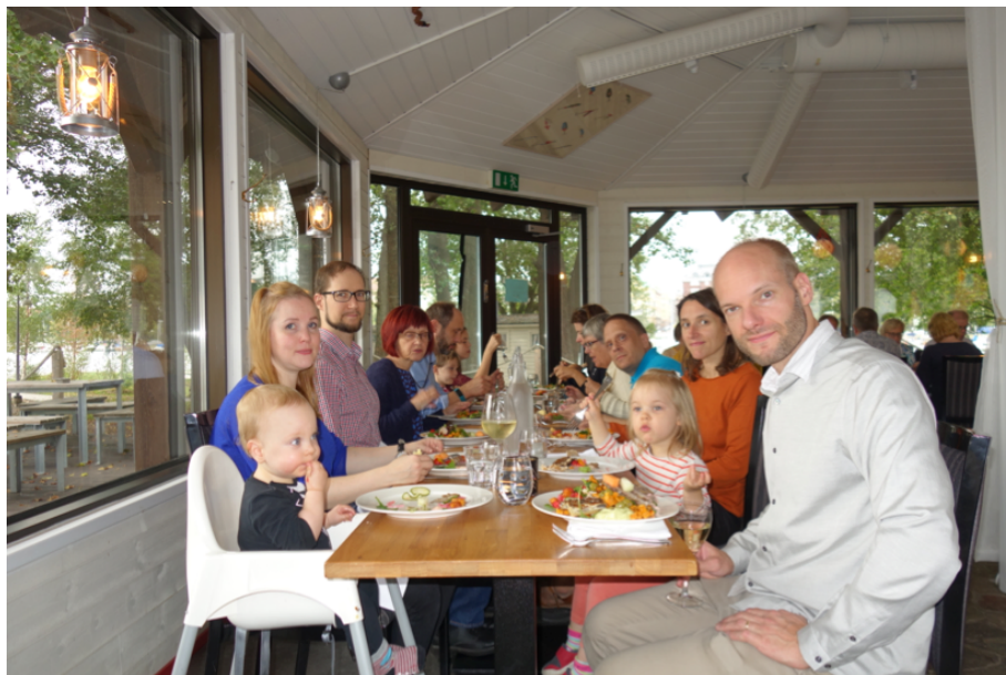
Suvun nuorempiakin saatiin mukaan retkelle.

Lähteet: Mannerheim-museon kotisivut https://www.mannerheim-museo.fi Mannerheim-museon lähettämät esitteet