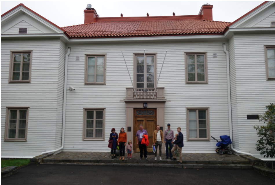
Sukulaisia Mannerheim-museon edustalla.