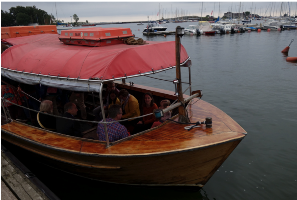
Yhteysalus väkeä pullollaan.