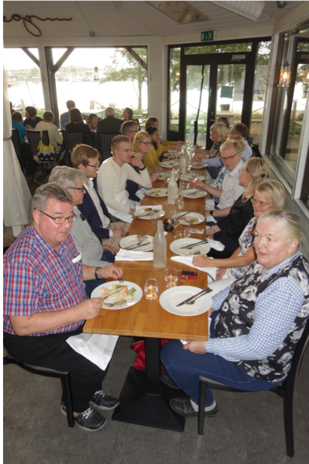
Syrjäset nauttivat ruuasta.