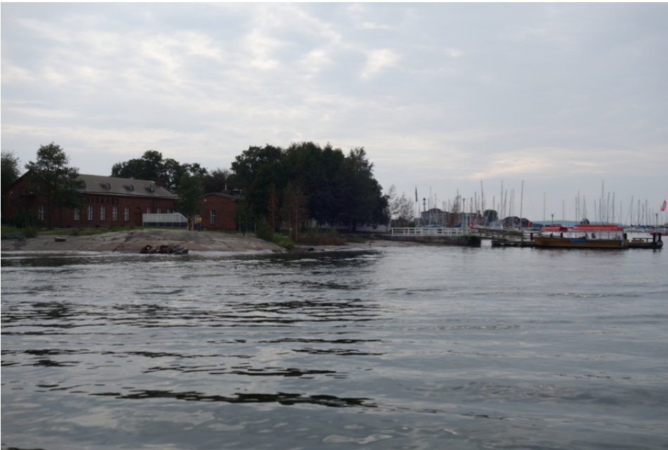
Yhteysaluksen mainingit keinuttavat rannalla olevia veneitä.