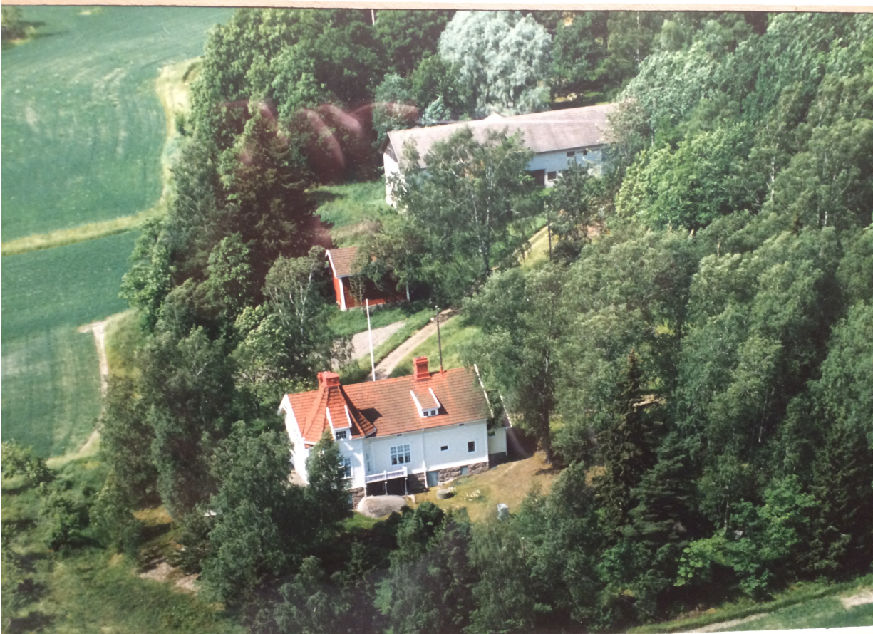
Maunulan tilan päärakennus, aitta ja navetta.