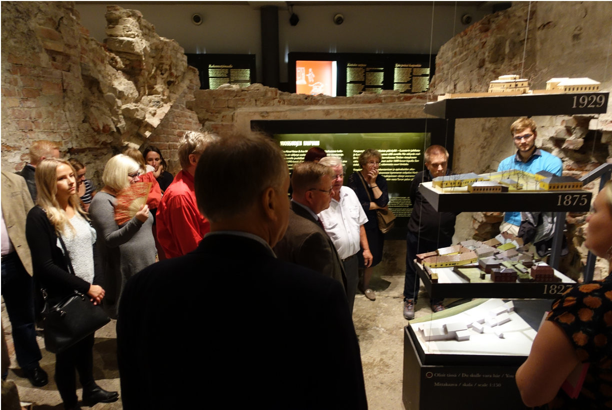
Rettigin palatsin puutarhan alapuolisen raunioalueen paikalla oli 1800-luvun alussa kivetty aukio, Vähätori, ja pitkä kivistä rakennus, jossa toimi Turun vanha tupakkatehdas.