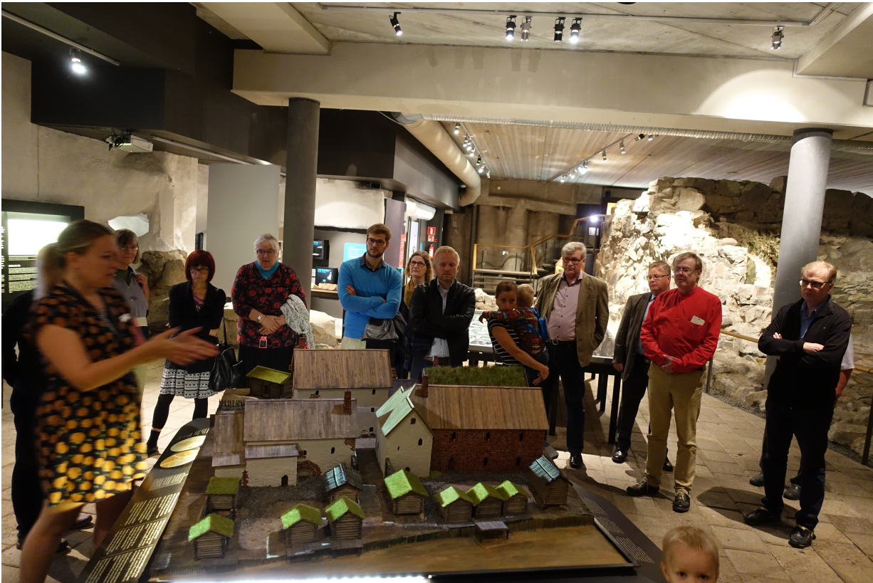
Syyriläiset ihmettelemässä kivitalojen pienoismallia. Kuvassa näkyy laiturit ja kauppa-aitat sekä kauppiaiden talot.