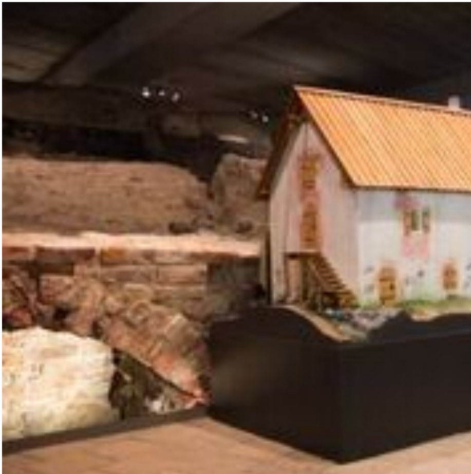
Kauppiaan talo.