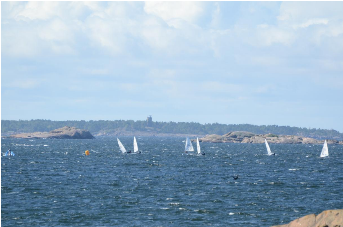
Näkymä Neljän Tuulen Tuvasta.