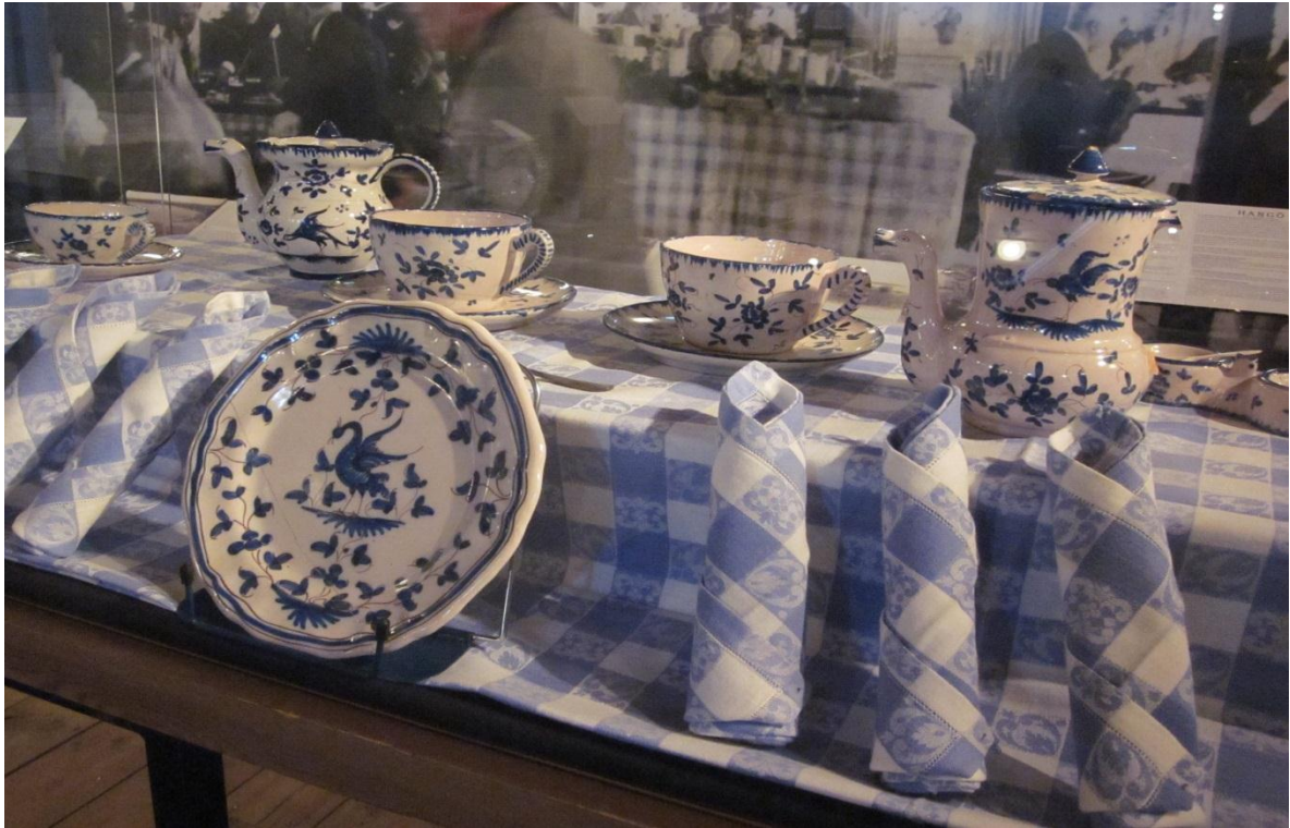
Museossa oli vanhoja kahviastioita Neljän Tuulen Tuvalta

Näyttelystä kävi ilmi, että Hangon vuokraaminen Neuvostoliiton tukikohdaksi talvisodan jälkeen 1940 oli raskas asia Mannerheimille. Kun Hanko valloitettiin takaisin 1941, hän vieraili kaupungissa ja kiitti Hangon rintamalla taistelleita joukkoja.