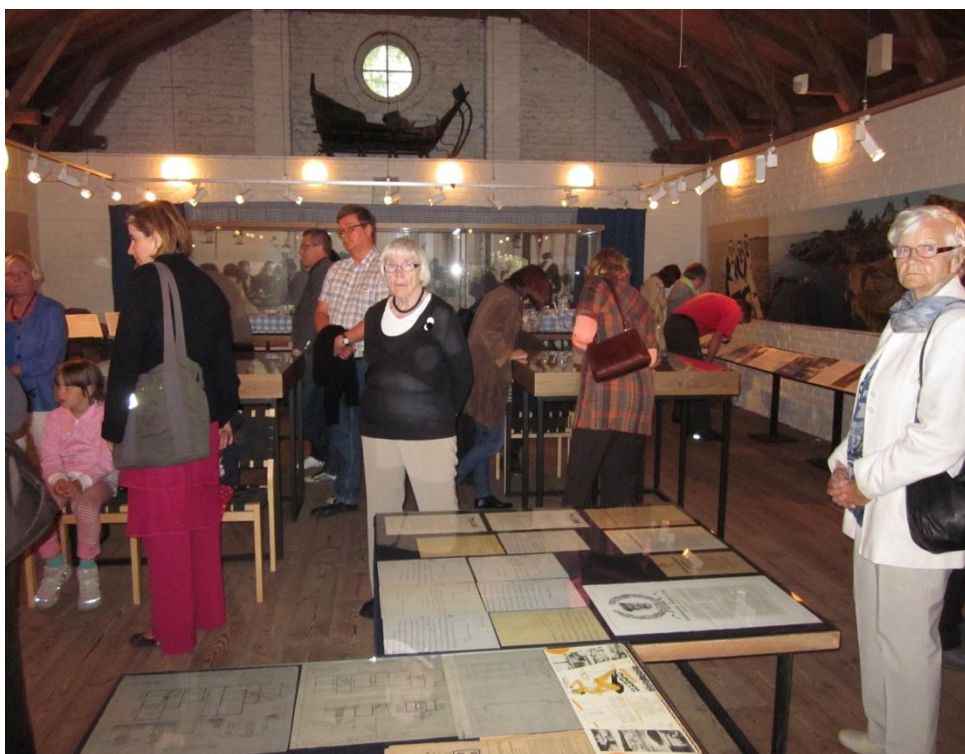
Museon valokuvia ja esineistöä tutkittiin tarkkaan

Näyttely painottui vuosiin 1919-1933, jolloin Mannerheim oli kirjoilla Hangossa. Tuolloin hänellä oli mahdollisuuksia käyttää aikaa lomailuun, matkusteluun, metsästysretkiin ja Hangon vilkkaaseen seuraelämään. Hankolaiset olivat ylpeitä arvostetusta kesävieraastaan. Villa Stormhällassa häntä kävi tervehtimässä jopa Euroopan kuninkaallisia ja muita tunnettuja henkilöitä. Näyttely kertoi myös Mannerheimin Lastensuojeluliiton Hangon osaston toiminnasta. Mannerheim nimittäin toimi vuonna 1920 perustetun Mannerheimin Lastensuojeluliiton puheenjohtajana.