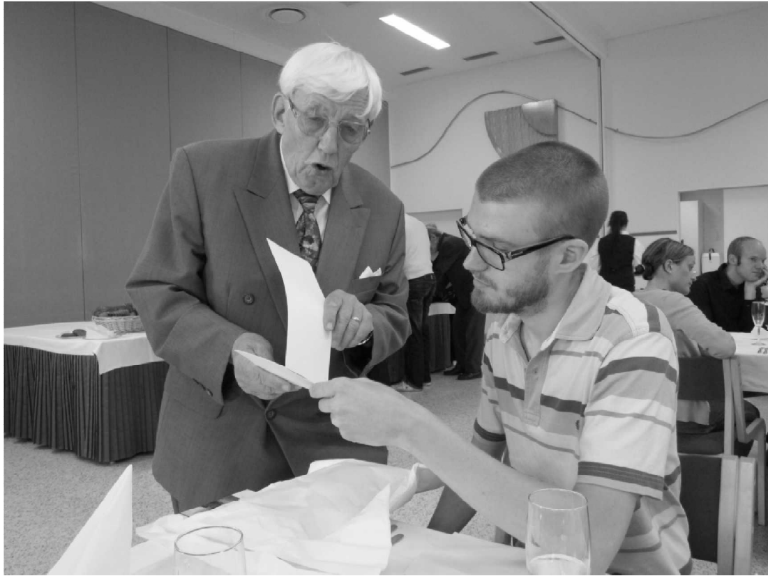
Sihteeri ja toimittaja tutkivat suvun kortteja