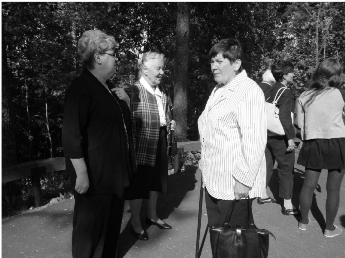
Lämmin sää suosi