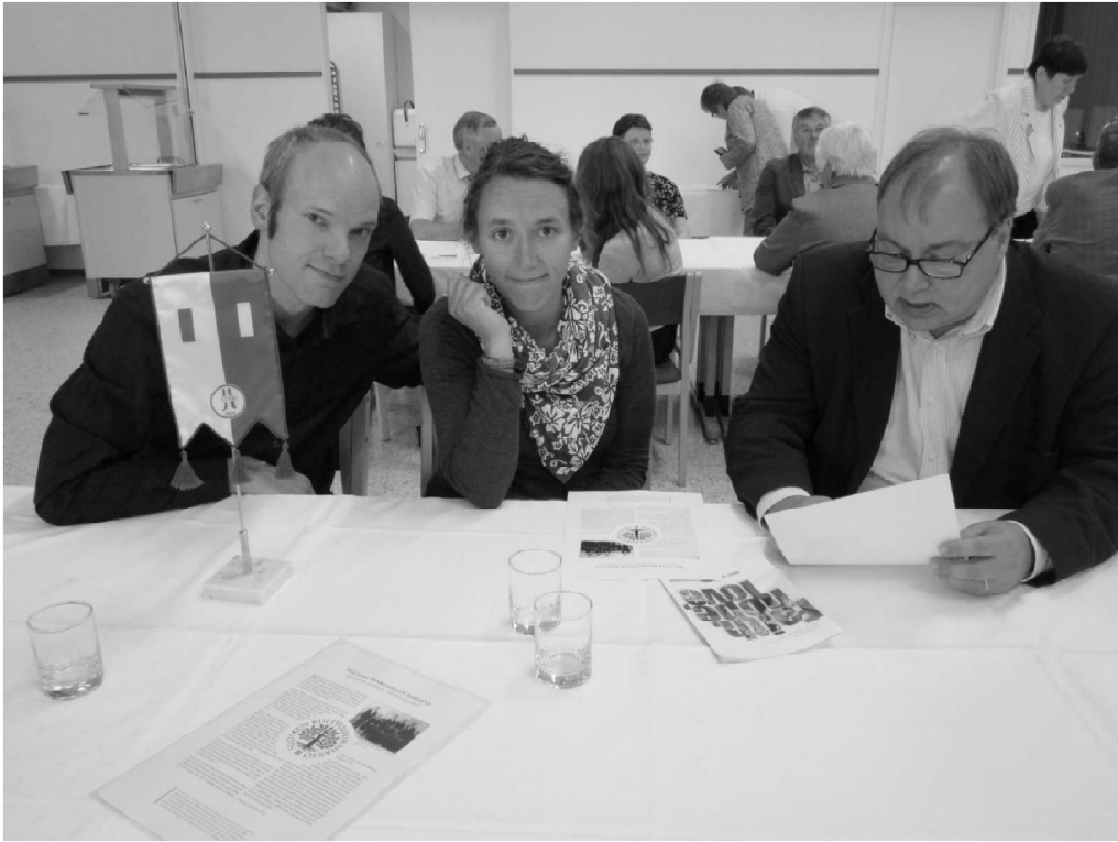
Suvun toimintaa suunnitellaan