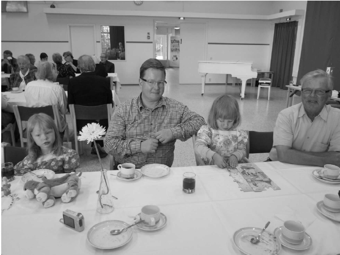
Suvun nuoretkin edustajat olivat päässeet matkaan