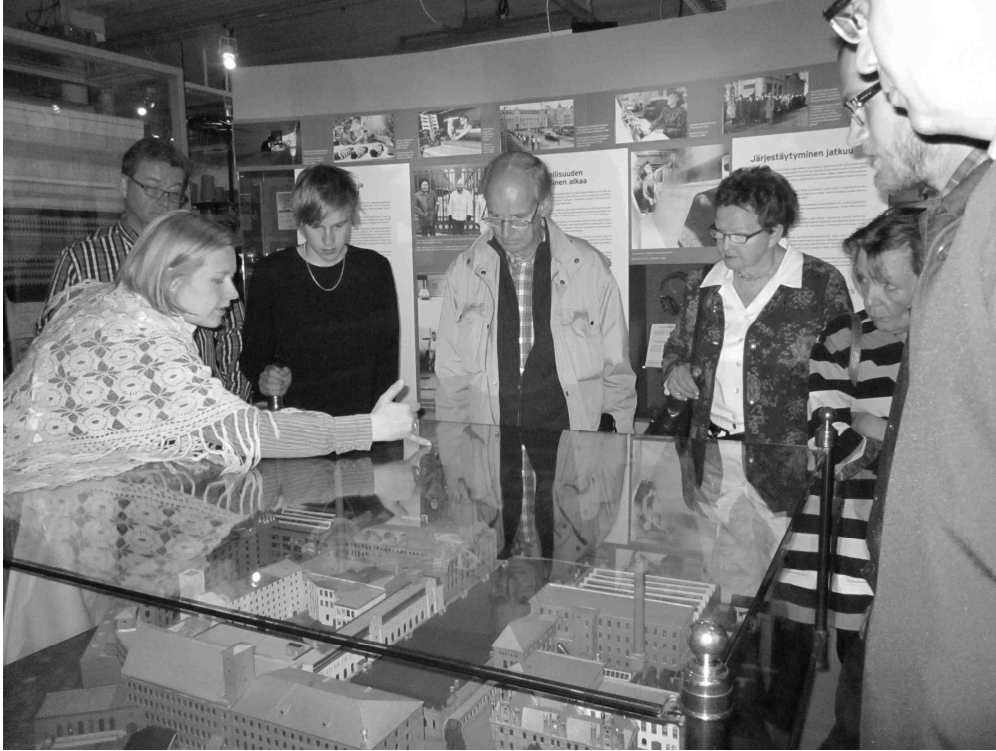
Opas esittelee Finlaysonin tehdasalueen pienoismallia