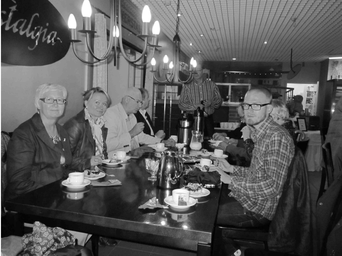
Opastetun kierroksen jälkeen nautittiin vielä kakkukahvit.