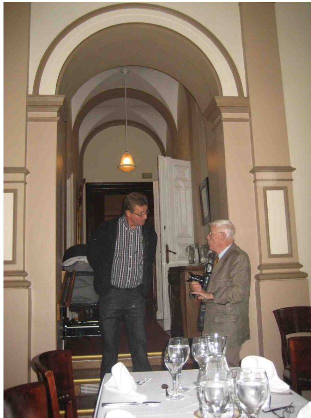
Sukuseuran puheenjohtaja ja sihteeri