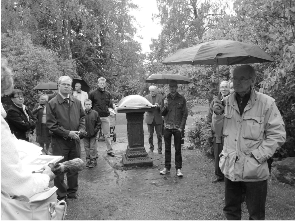
Sade yllätti kesken kierroksen.