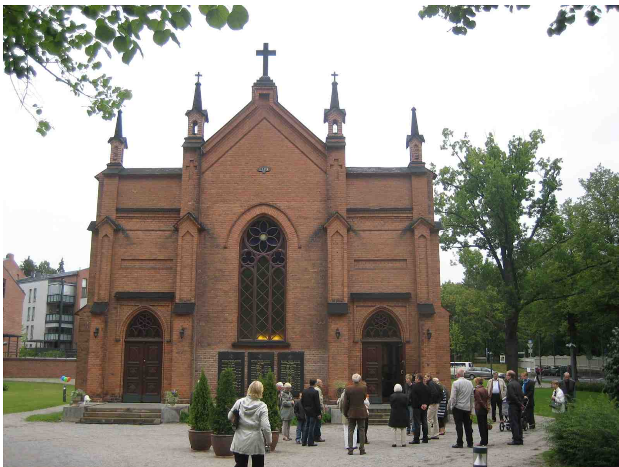
Sukua Finlaysonin kirkon luona