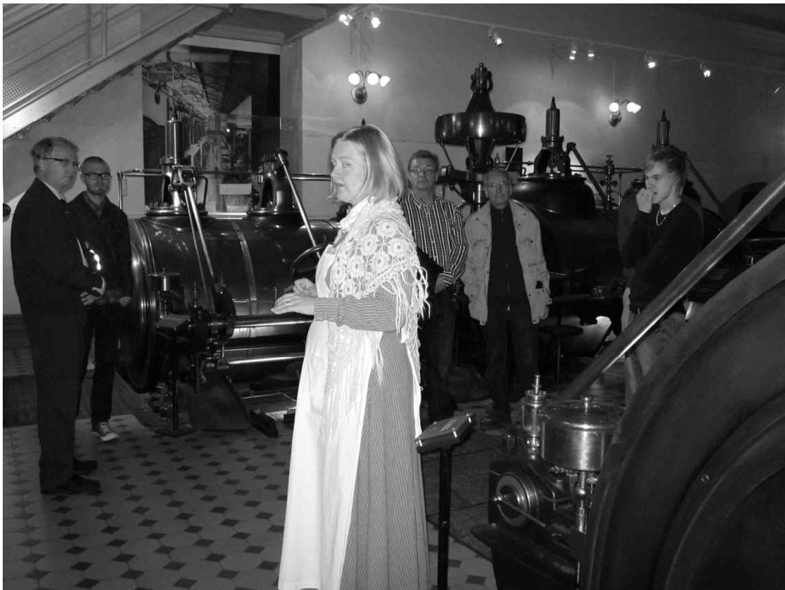
”Sulzer-höyrykone tuotti voimaa Finlaysonin tehtaan kehräämön, kutomon ja värjäämön tarpeisiin. Konejättiläinen oli käytössä päivittäin vuosina 1900–1926 ja varavoimana aina 1950-luvun puoliväliin asti. Sulzer on Suomen suurin tehdashöyrykone.” (Teksti museosta.)