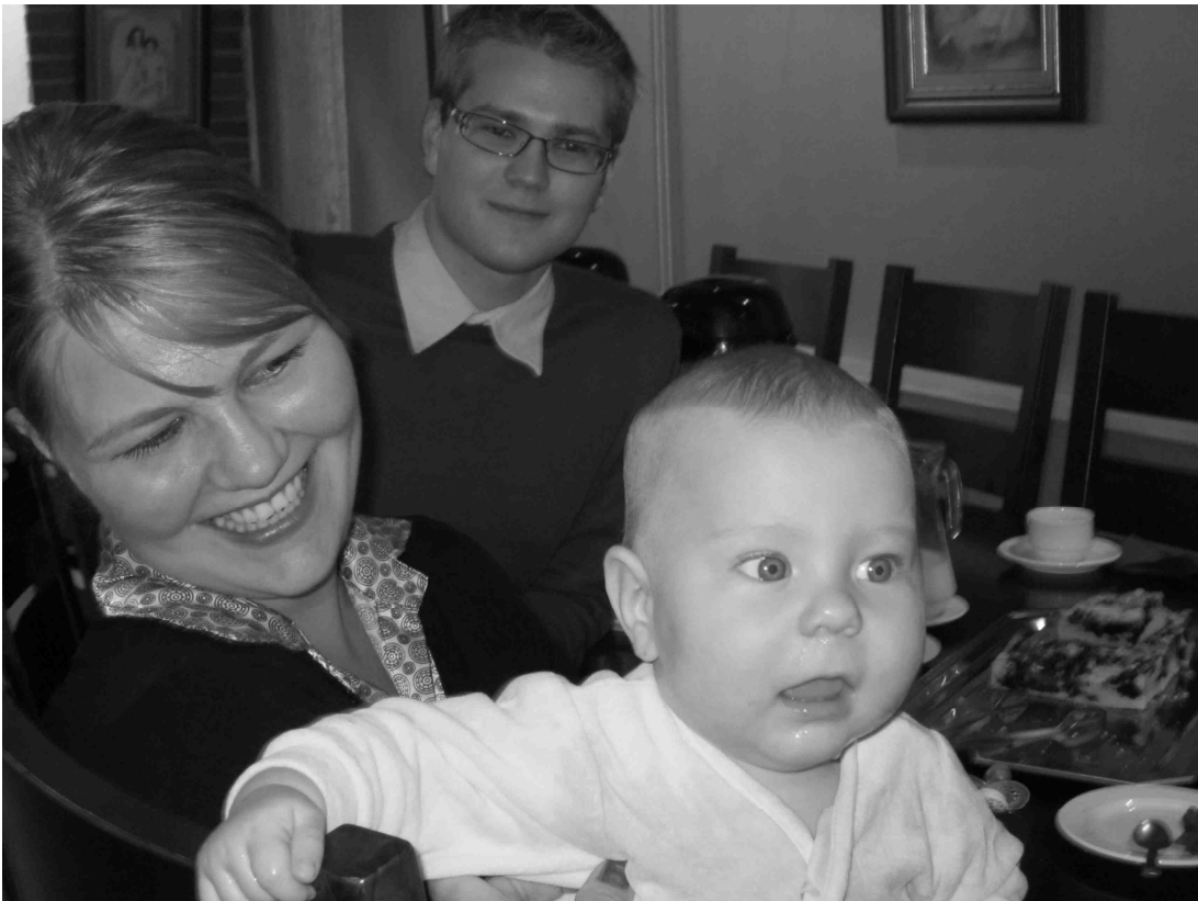
Suvun jälkikasvuakin oli päässyt kierrokselle mukaan!