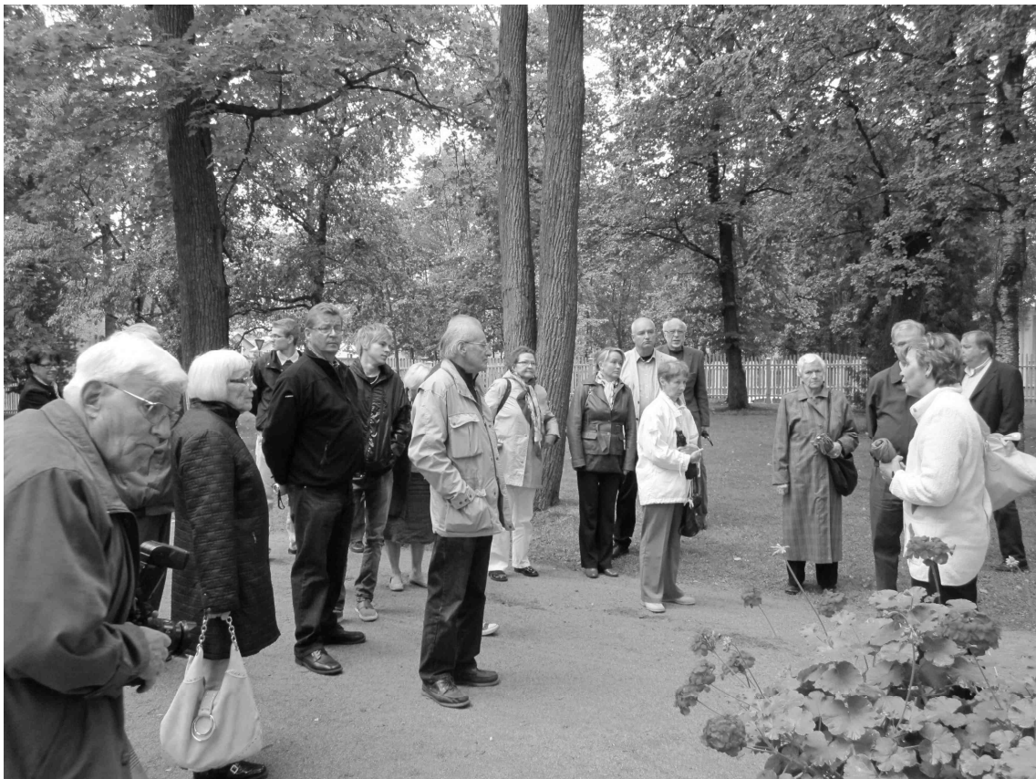
Sukulaiset kuuntelevat opasta.