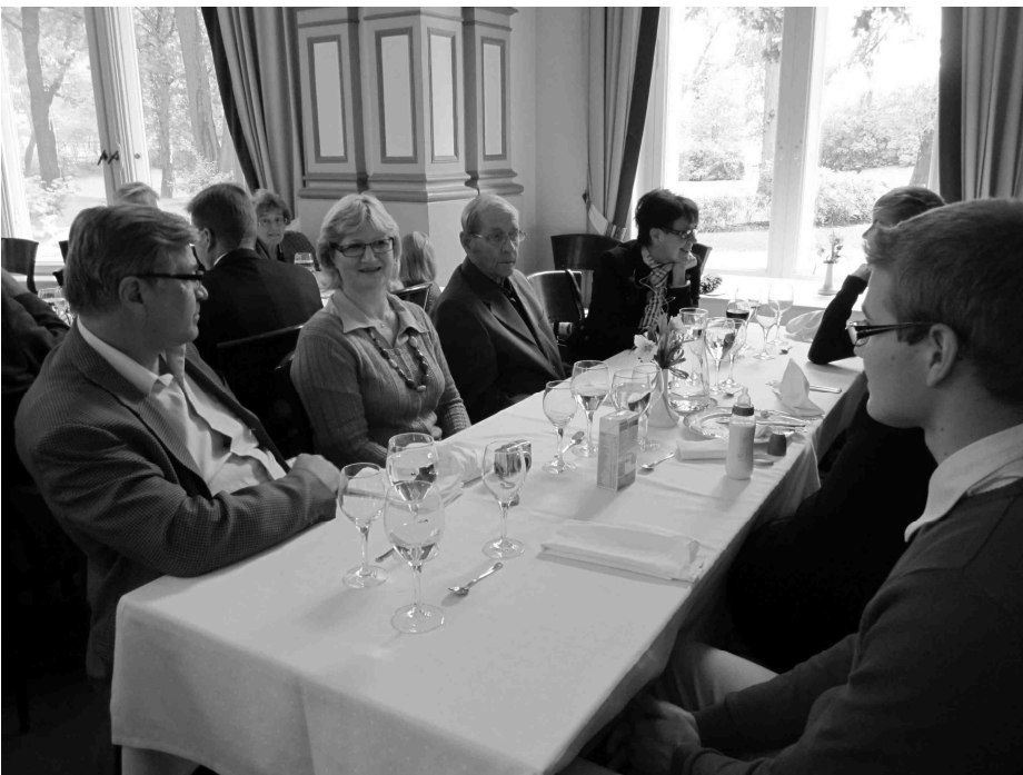
Finlaysonin palatsilla nautittiin maittava ateria.