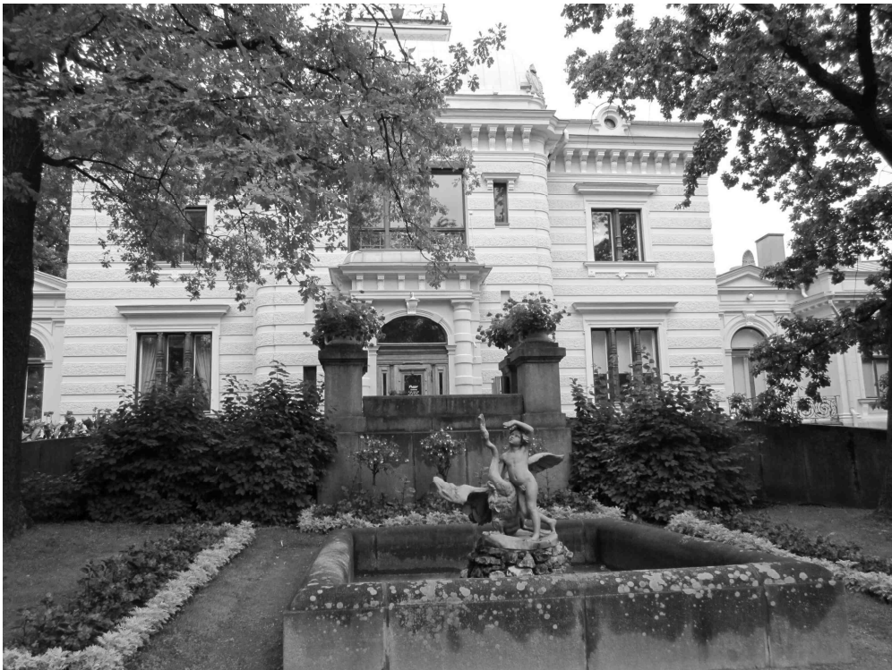
Finlaysonin palatsin suihkulähde