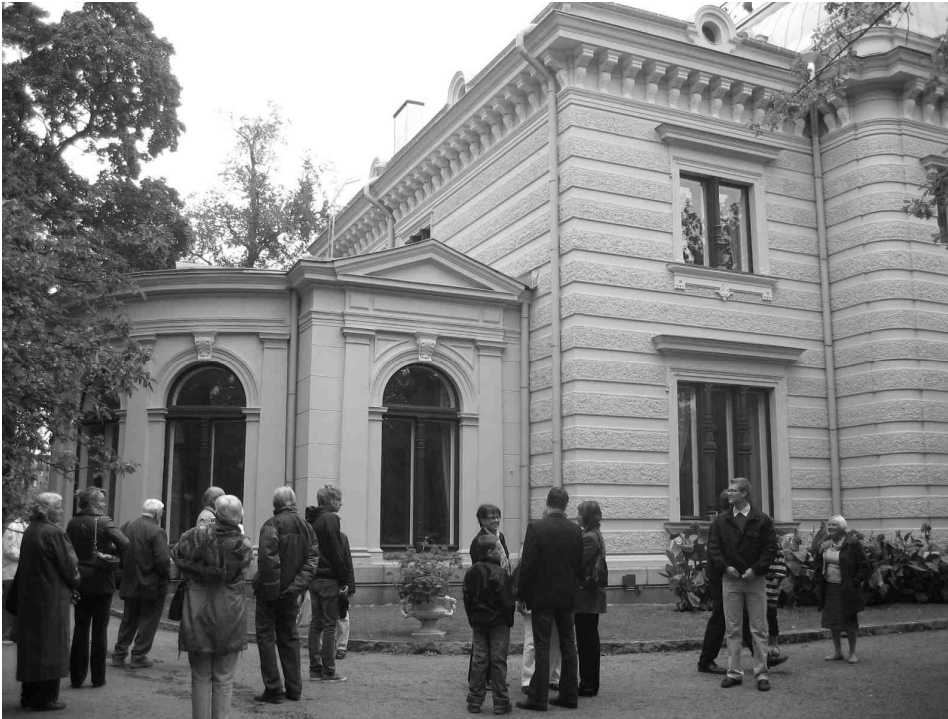
Finlaysonin hienon palatsin pihalla sukulaisia opastetulle kierrokselle lähtemässä.