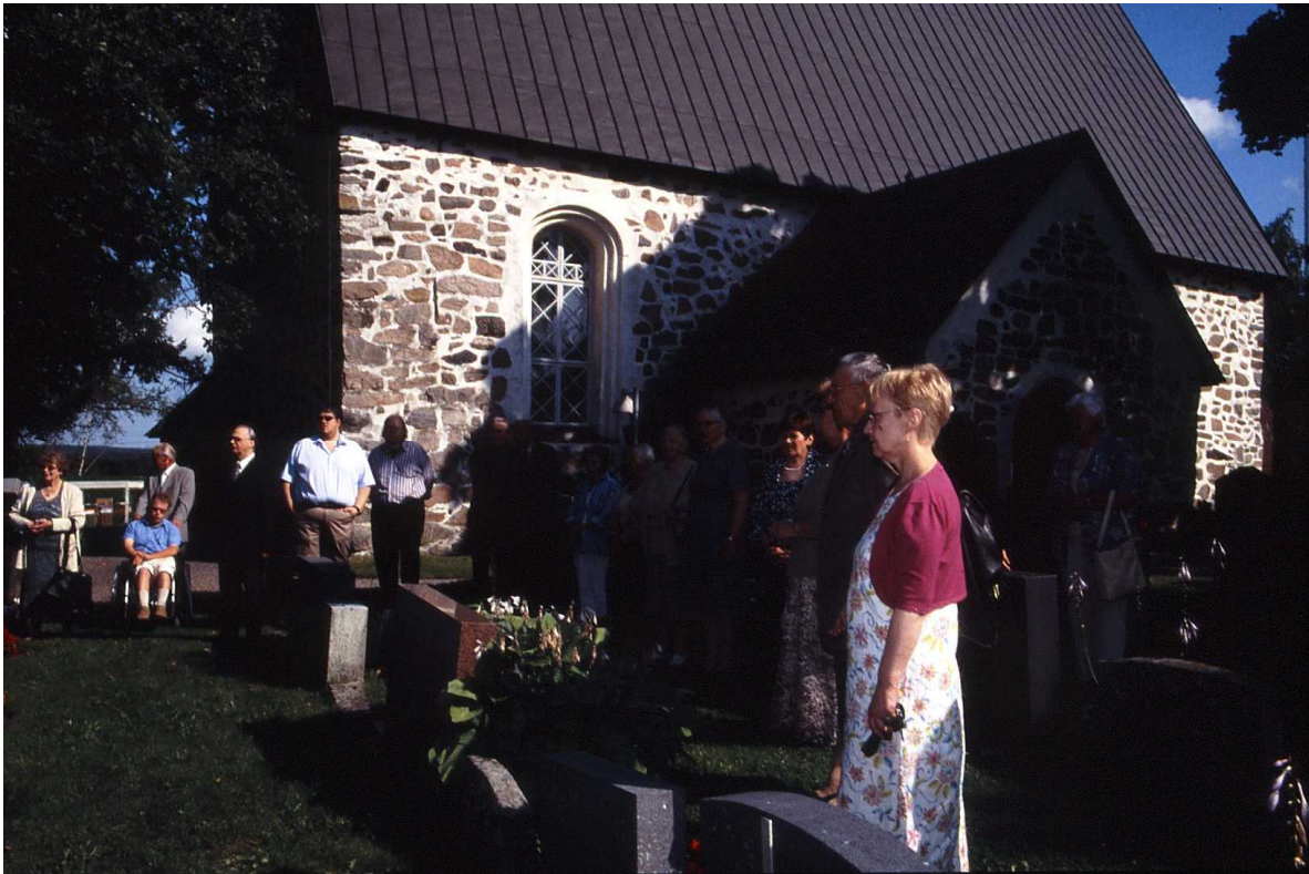
Sukulaisia Liedon kirkolla.