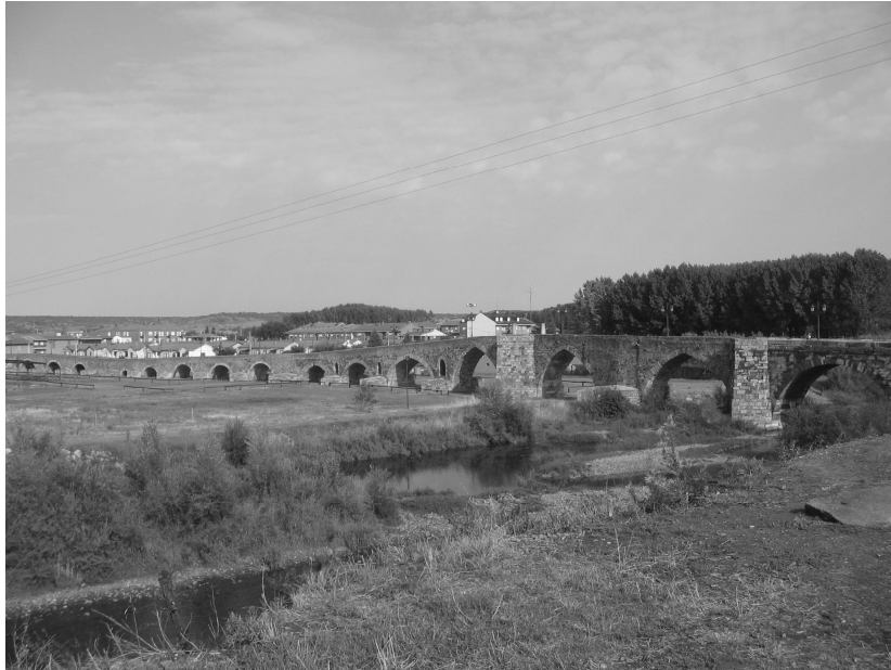
Keskiaikainen silta Órbigossa

Pääsimme tervehtyneinä jatkamaan matkaa, jota oli jäljellä 10 päivää, jos vain pysyisimme aikataulussa. Loppumatka oli aikamoista nousua ja laskua: ylimmillään olimme yli 1500 metrin korkeudessa, alimmillaan merenpinnan tietämällä. Maisemat olivat hienot, mutta varsinkin nousu rinka selässä oli välillä raskasta.