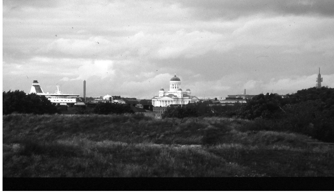
Helsinkiä Suomenlinnasta nähtyä

Kokouksen päätyttyä nautittiin maittavat kakkukahvit ja oltiin valmiit lähtemään opastetulle kierrokselle tutustumaan Suomenlinnan historiallisiin nähtävyyksiin. Aamuinen sade oli vaihtunut aurinkoiseksi alkusyksyn iltapäiväksi. Samalla tuli hyötyliikunnan merkeissä hyvän oppaan kertomana iso annos tietoa Suomen historiastakin. Opas kertoi myöskin paljon sellaista tietoa, mitä ei mistään historian kirjoista löydy.