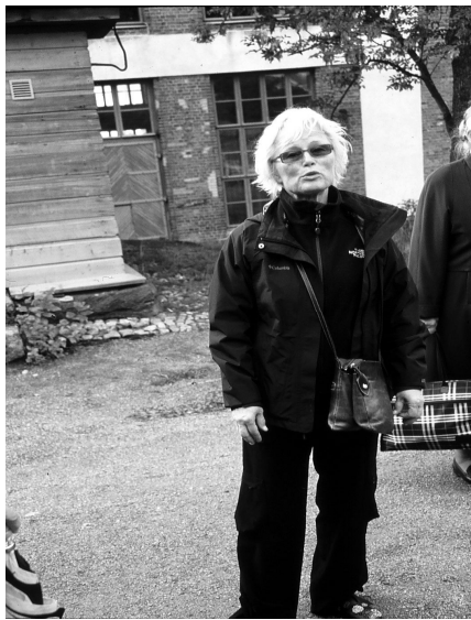
Opas kertoo Suomenlinnan historiasta

Tyytyväisyydellä todettiin, että sukuseuran kotisivut ovat avautuneet ja otettu heti käyttöön.