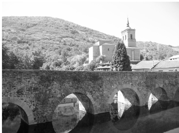
Toinen silta eräässä vuoristokylässä

Viimeiset päivät ennen Santiagoa olivat hyvin kuluttavat, niin henkisesti kuin fyysisestikin. Teimme pitkiä päivämatkoja, joista pisin oli yli 40 kilometriä sisältäen runsasta nousua. Itse käveleminenkin alkoi puuduttaa, eivätkä lukuisat pikkukylät tarjonneet enää mitään uutta.