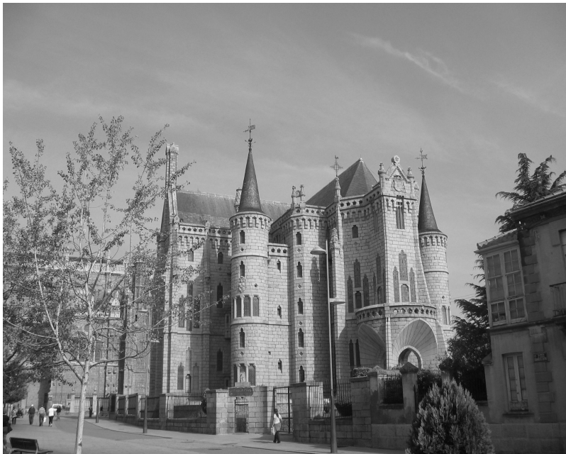
Matkalla törmää useisiin kuuluisiin nähtävyyksiin, kuten tähän Gaudin suunnittelemaan palatsiin Astorgassa