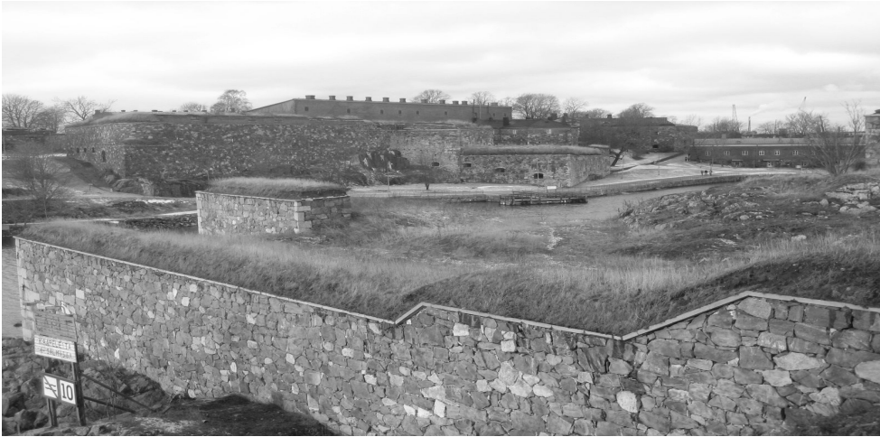
Kuvassa näkymä Suomenlinnan tykistölahden ympäristöstä

Suomenlinna on mittava merilinnoitus, ainutlaatuinen, kulttuurihistoriallinen Unescon maailmanperintökohde. Suomenlinna on merkinnyt suurta roolia Suomen ja koko Itämeren historiassa. Samalla se on tänä päivänä yksi elävä Helsingin kaupunginosa, jossa asuu noin 850 helsinkiläistä.