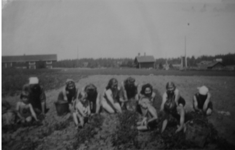
Lapsia tarvittiin työssä, esim. tässä porkkanapellolla