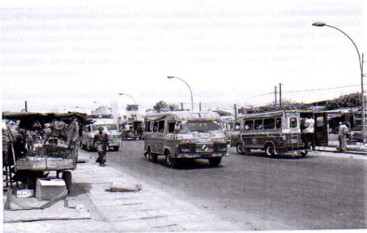
Keltaiset bussit kävelykadulla

järjestyssäännöt kun näyttävät olevan hiukan toisenlaiset kuin meillä Suomessa. Kadut ovat hiekan ja pölyn peittämiä, ja niitä reunustavat valkoiset kesken jääneet rakennukset. Katunäkymään kuuluvat myös pienet koraanikoulujen lähettämät kerjäläiset. Kyseessä on islamilaisten koraanikoulujen oppilaat eli talibit, jotka hankkivat elantonsa kaduilla kerjäämällä. Kerjäämisen kautta lapset oppivat nöyryyttä ja yksinkertaisen elämän hyveitä, mutta siinä voi helposti ajautua rikoksen tielle. Nämä kaikki yksityiskohtat luovat tietynlaisen tunnelman, johon sopeudumme hyvin nopeasti. Muutaman päivän kuluttua emme enää kiinnitä näihin yksityiskohtiin, tunnelma vaikuttaa kotoisalta ja silmä ja korva ovat jo tottuneet kaikkeen uuteen.