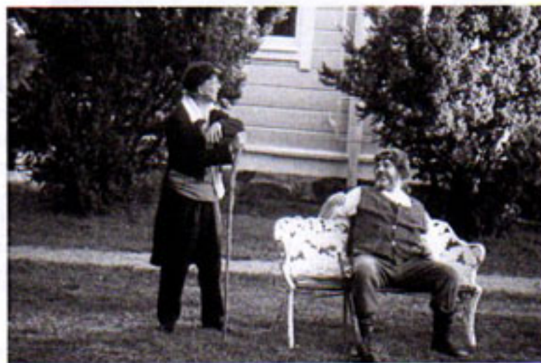
J.L. Runeberg ja Katkon krouvari