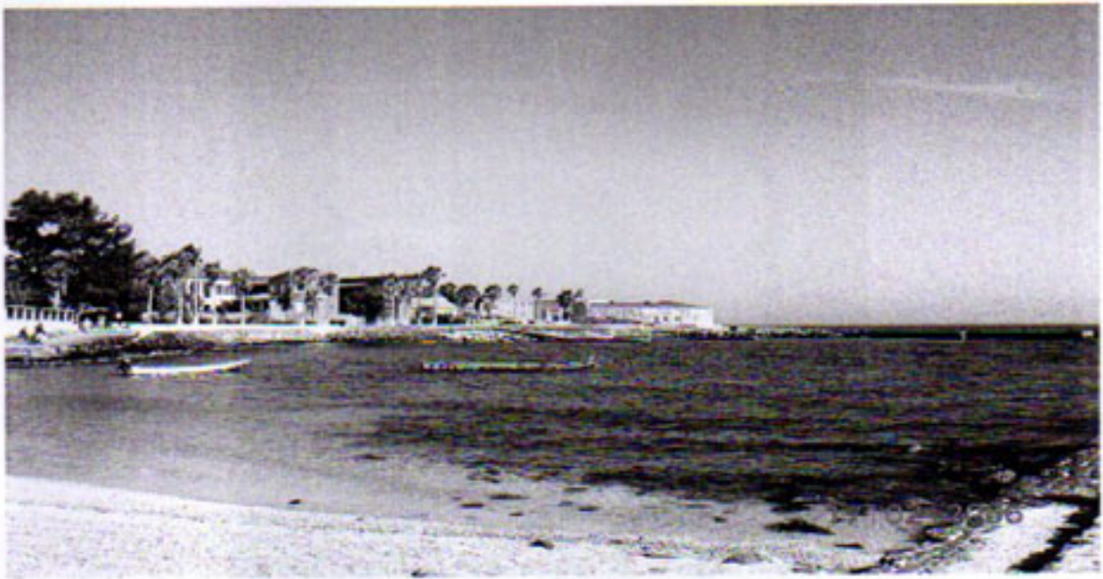
Ile de Gordee Ita. Orjakaupastaan tunnettu saari

Suomalaisena oli vaikeata ymmärtää, kuinka paikallisilla on aikaa ja energiaa loputtomiin kestävään keskusteluun. Kun menin haastattelemaan pro graduani varten hankittujani koehenkilöitä, meillä meni kokonainen iltapäivä teeseremoniaan ja yleiseen keskusteluun. Pitkän juttutuokion jälkeen aloin suomalaisena välillä kaivata omaa rauhaa tai hiljaisia hetkiä, jolloin olisin voinut hengähtää. Ajattelin, että hoputtelu olisi epäkohteliasta ja osoitus kärsimättömyydestä. Kuukausi, jonka olin varannut materiaalin keruuseen, vaikutti hyvin lyhyeltä ja kiire yllättikin matkan loppuvaiheessa.