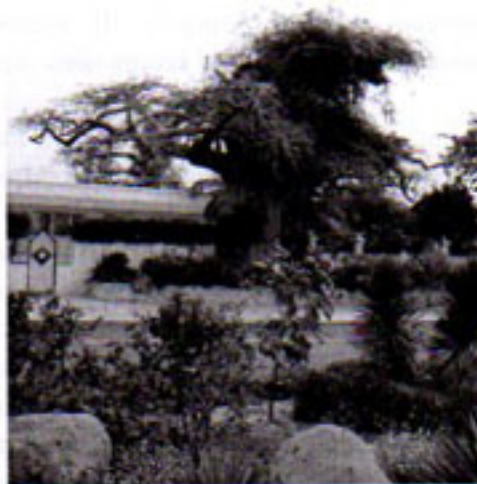
Apinanleipäpuu Baobab kukkii

Suomalaisena oli vaikeata ymmärtää, kuinka paikallisilla on aikaa ja energiaa loputtomiin kestävään keskusteluun. Kun menin haastattelemaan pro graduani varten hankittujani koehenkilöitä, meillä meni kokonainen iltapäivä teeseremoniaan ja yleiseen keskusteluun. Pitkän juttutuokion jälkeen aloin suomalaisena välillä kaivata omaa rauhaa tai hiljaisia hetkiä, jolloin olisin voinut hengähtää. Ajattelin, että hoputtelu olisi epäkohteliasta ja osoitus kärsimättömyydestä. Kuukausi, jonka olin varannut materiaalin keruuseen, vaikutti hyvin lyhyeltä ja kiire yllättikin matkan loppuvaiheessa.